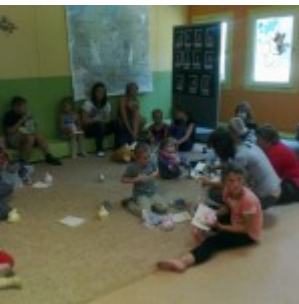
Pożkolenie w świetlicy...