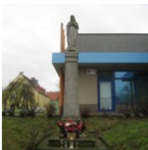
ul. Powstańców Wlkp.