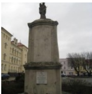
Pl. 20 Października