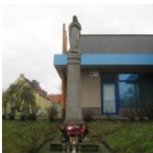
ul. Powstańców Wlkp.