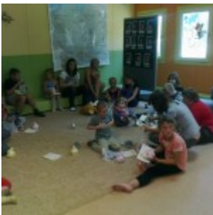
Pożkolenie w świetlicy...