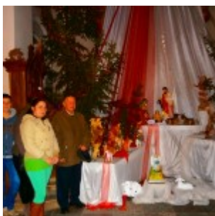
OLYMPUS DIGITAL CAMERA