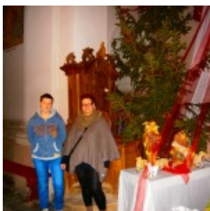
OLYMPUS DIGITAL CAMERA