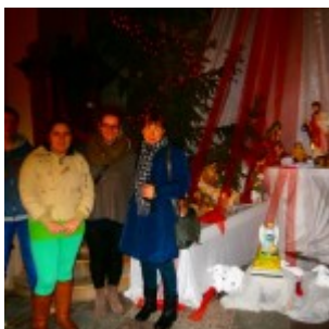
OLYMPUS DIGITAL CAMERA