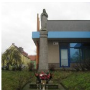
ul. Powstańców Włkp.