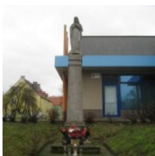
ul. Powstańców Włkp.